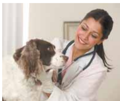
График временных пунктов вакцинации животных на 2011 г. в районе Аэропорт: